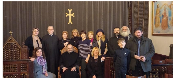
Le 24 mars 2023, la cérémonie de prière du vendredi à l'église Saint Grégoire l'Illuminateur de Chaville.