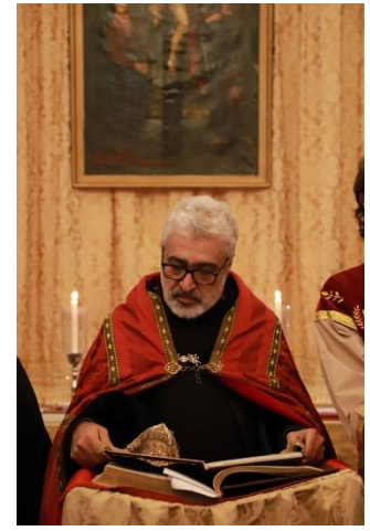
Le 17 mars 2023, la cérémonie de prière du vendredi à l'église Sainte-Croix-de-Varak d'Arnouville.