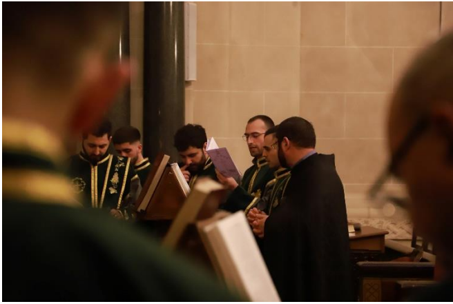
Le 31 mars 2023, la cérémonie de prière du vendredi en la Cathédrale apostolique arménienne Saint-Jean-Baptiste de Paris.