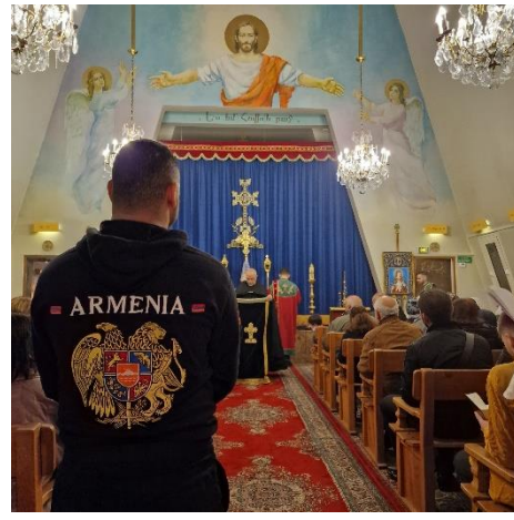
Le 10 mars 2023, la cérémonie de prière du vendredi à l'église Sainte-Marie-Mère-de-Dieu d'Issy.