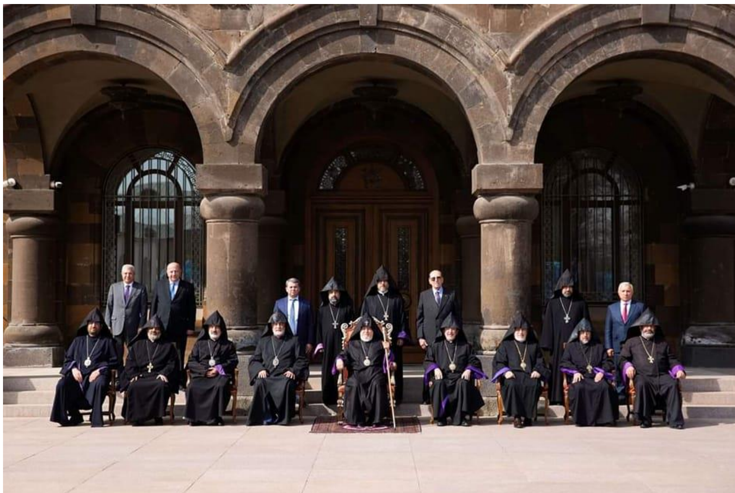
Conseil Suprême, Saint-Siège d'Etchmiadzin 2023

Ayant pour priorité le salut et la sécurité des vies humaines, notre Sainte Église apostolique défendra sans cesse la concrétisation du droit à l'autodétermination du peuple d'Artsakh sur la base du principe de « l'indépendance pour le salut et la sécurité ».