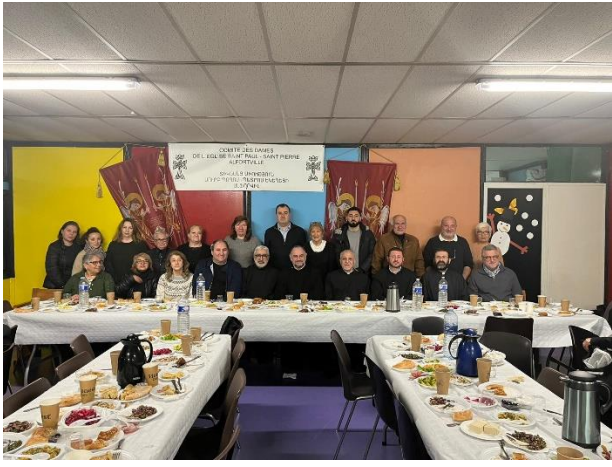
Le 3 mars 2023, première cérémonie de prière du vendredi à l'église St. Paul St. Pierre d'Alfortville.