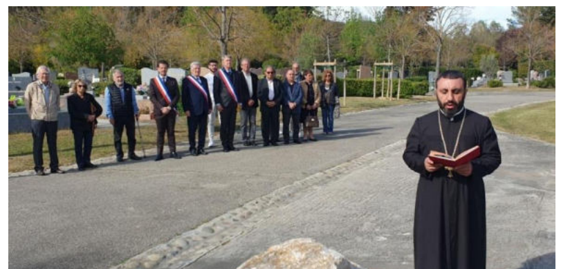
Père Komitas TIGRANYAN