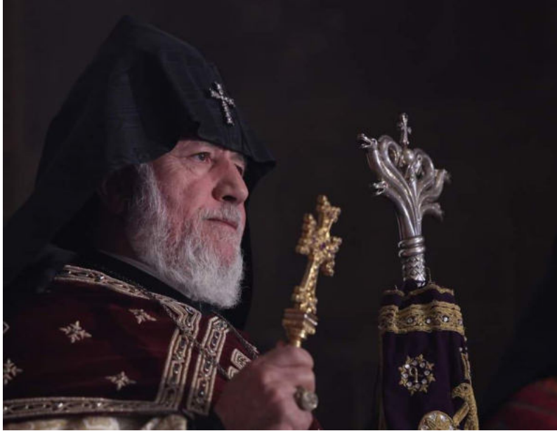
Sa Sainteté KAREKIN II Patriarche Suprême et Catholicos de tous les Arméniens